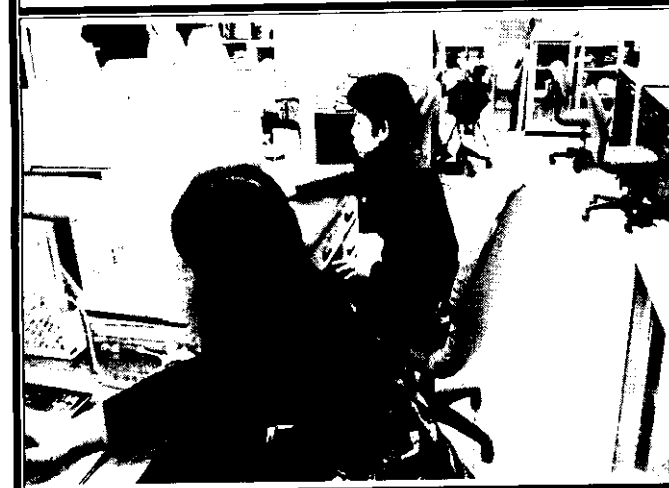
良好的教學方式分享