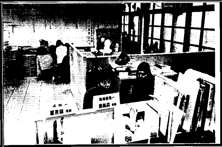
學生參與全國語文競賽培訓計畫