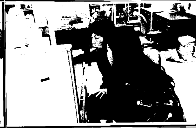
良好的教學方式分享