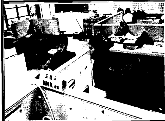
學生參與全國語文競賽培訓計畫