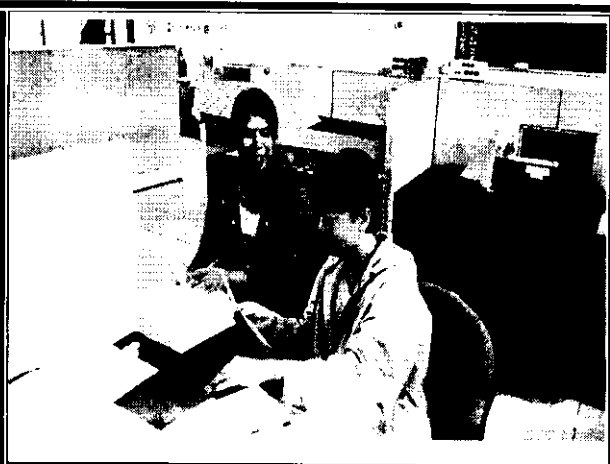
老師就討論提案提出意見