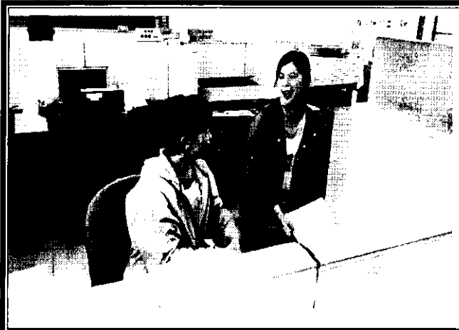
老師就討論提案提出意見