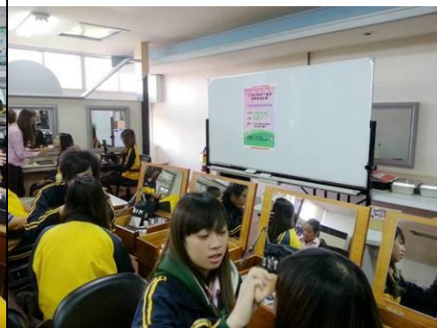
照片說明：舞台妝實作練習