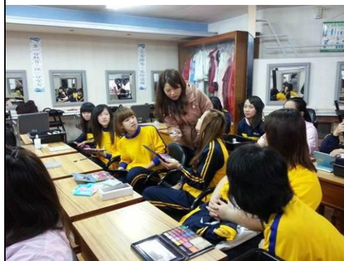
照片說明：整體造型設計指導