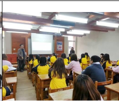
照片說明：紙芝居介紹