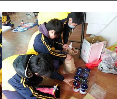
照片說明：黑光劇道具製作