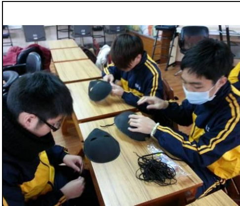
照片說明：黑光劇道具製作