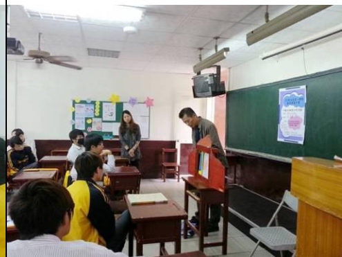
照片說明：指導學生說演技巧