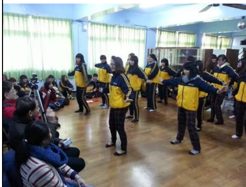
照片說明：校內預演-活動帶領