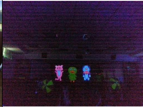
照片說明：校外預演-黑光劇表演