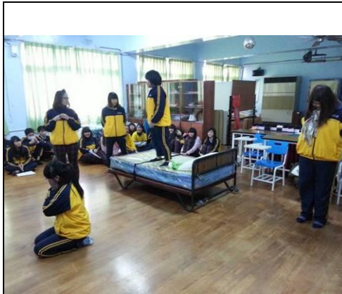
照片說明：校內預演-舞台劇表演