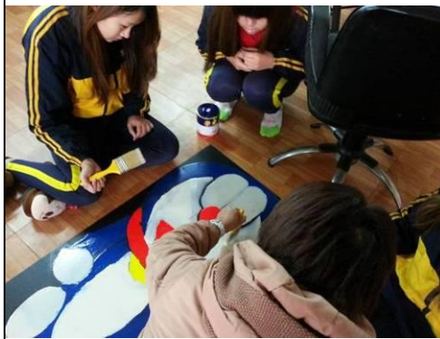
照片說明：黑光劇道具製作