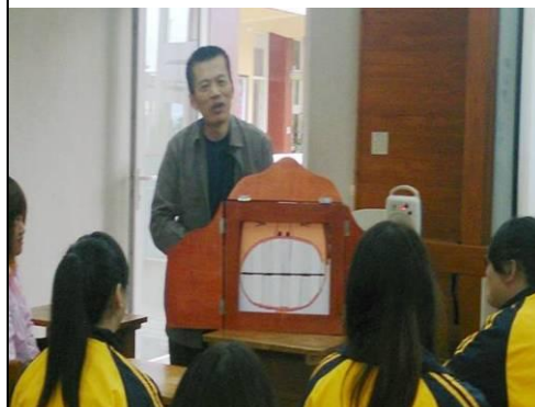
照片說明：紙芝居製作與說明