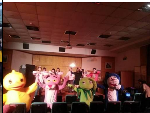
照片說明：校外預演-活動帶領