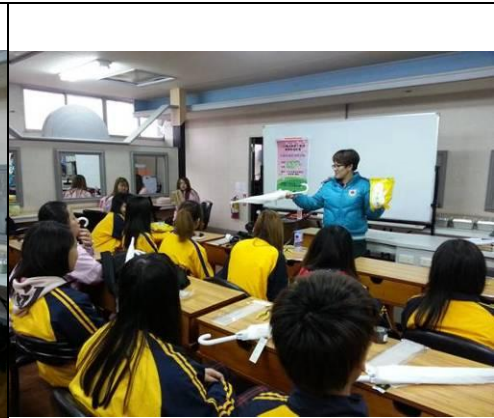
照片說明：舞台道具製作說明