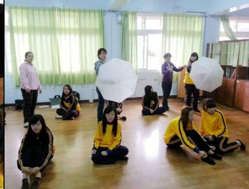
照片說明：黑光劇排練