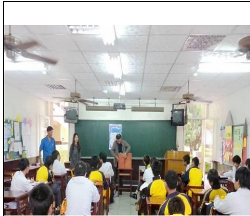
照片說明：紙芝居展示