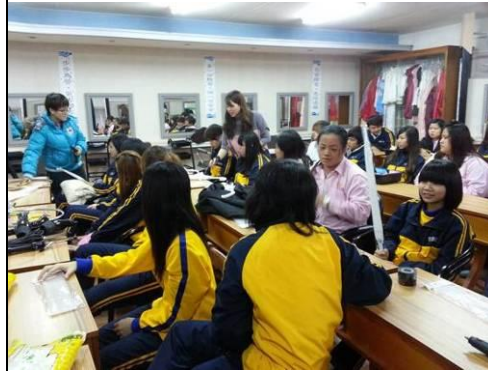
照片說明：舞台道具製作指導