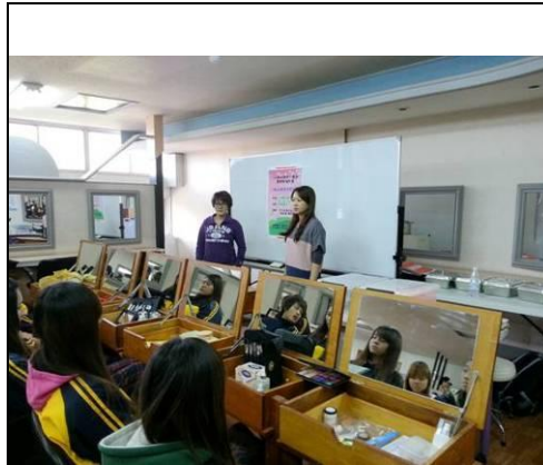
照片說明：舞台造型介紹