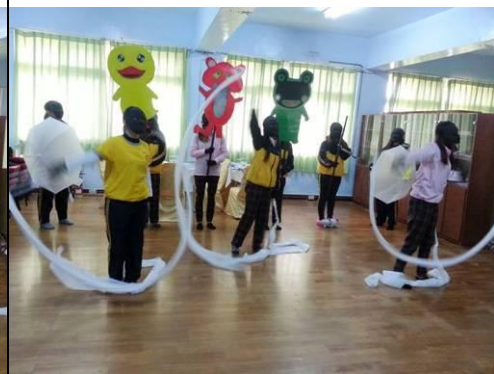
照片說明：黑光劇排練