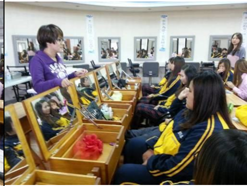
照片說明：整體造型設計說明