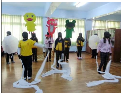
照片說明：黑光劇排練