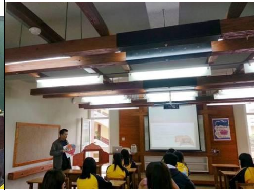
照片說明：紙芝居的使用方式