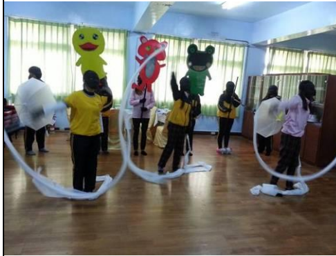
照片說明：校內預演-黑光劇表演