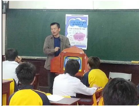
照片說明：用途與目的說明