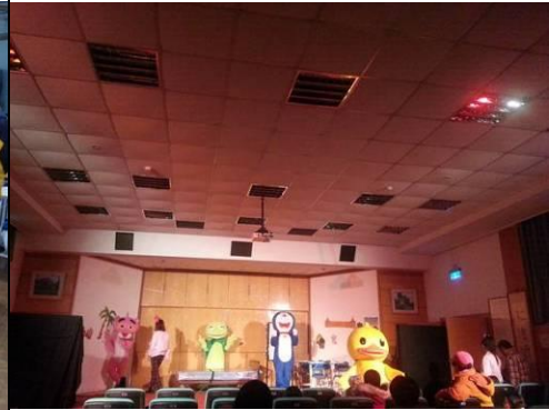
照片說明：校外預演-舞台劇表演