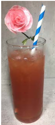
圖上所裝飾的玫瑰花為威化紙所製，亦為可食用材料。