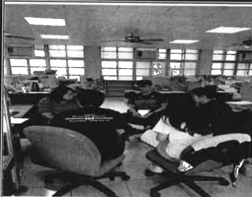
烘焙檢檢加強方法