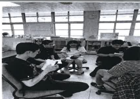
討論中餐丙檢加強方法