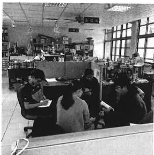
討論有些科目須自編教材