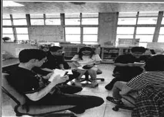
討論中餐丙檢加強方法