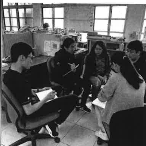
討論實習教室使用方法