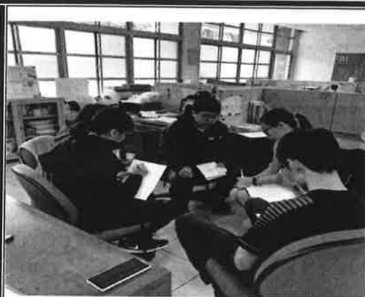
解說教學進度與實習進度表的不同