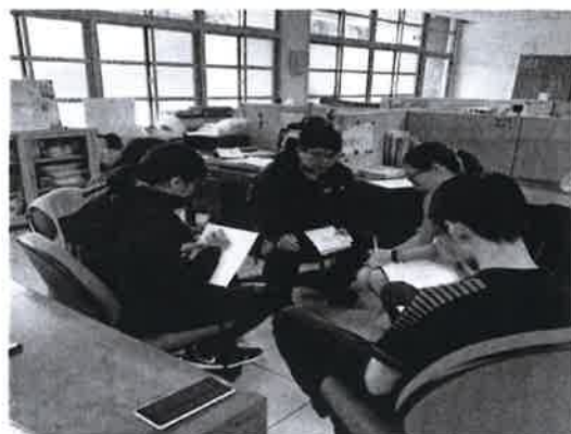
解說教學進度與實習進度表的不同