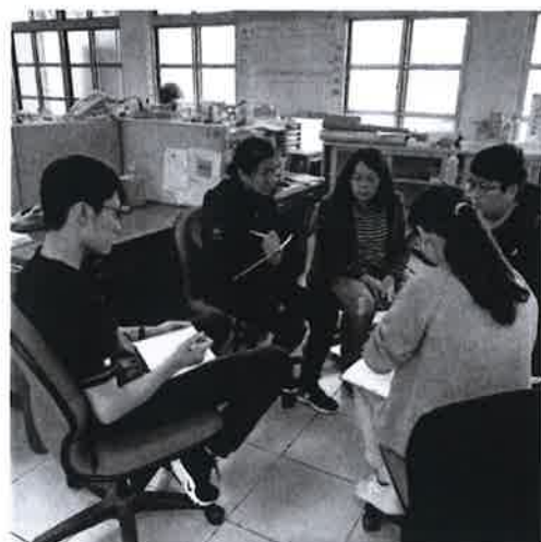
討論實習教室使用方法