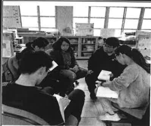
講解教室使用規範