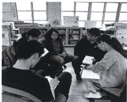
講解教室使用規範