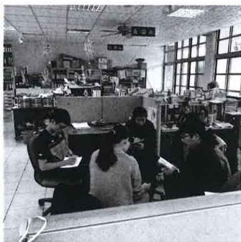
討論有些科目須自編教材