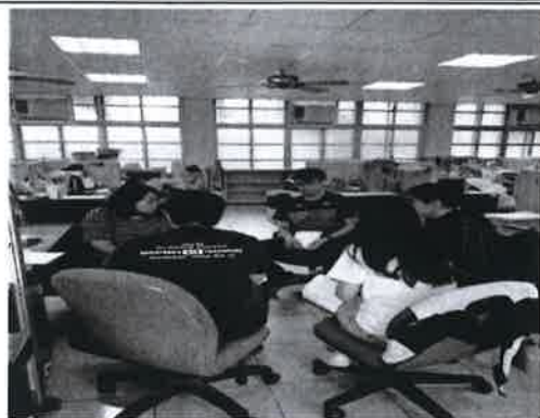
烘焙檢檢加強方法