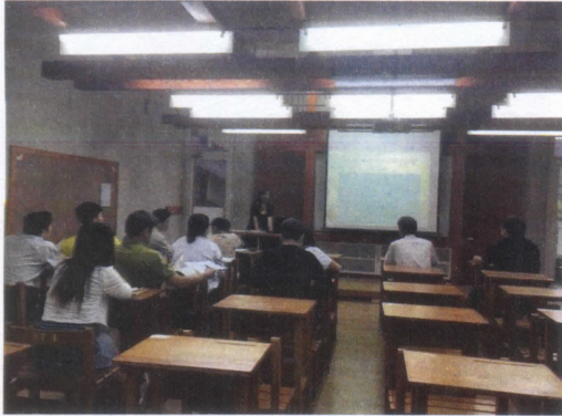
均質化第一次管制會議開始