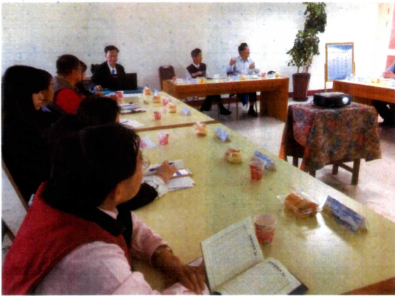
許全守教授講評(二)