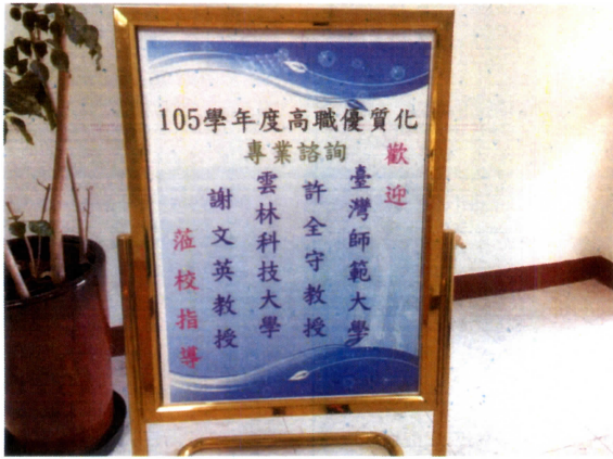
專業諮詢歡迎海報