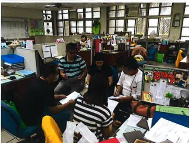
說明課程搭配丙檢訓練教科書