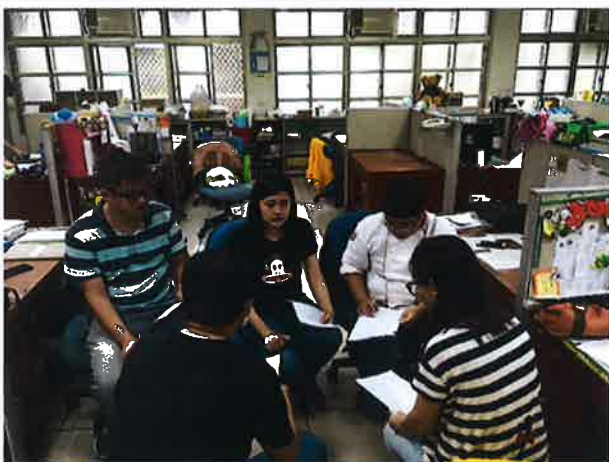
討論及發表自己想法