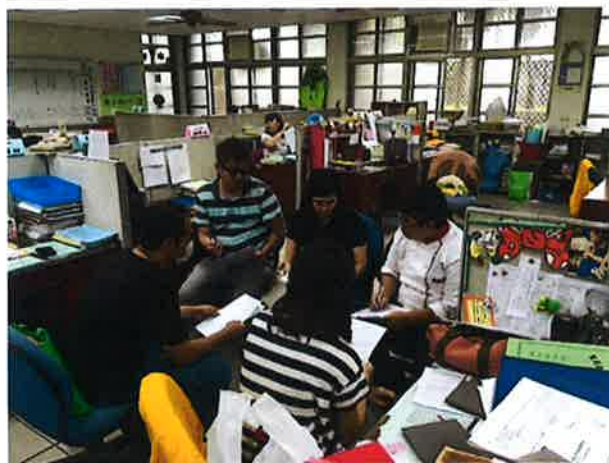
說明課程搭配丙檢訓練教科書