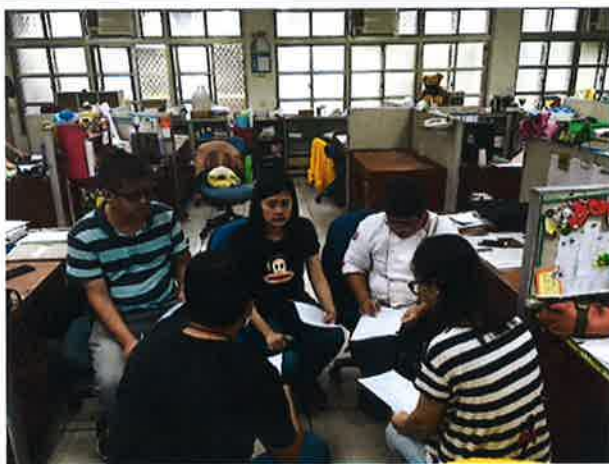
討論及發表自己想法