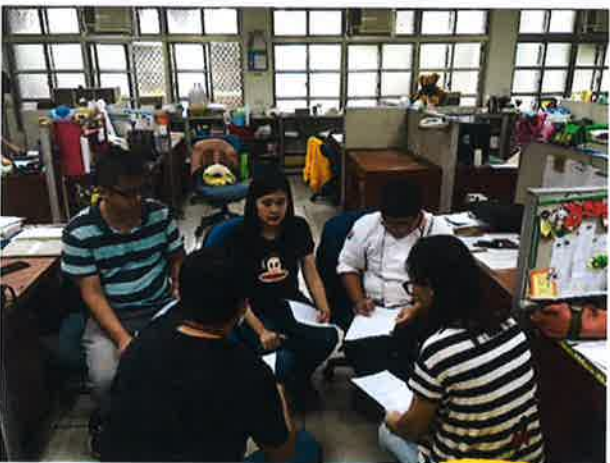
討論及發表自己想法