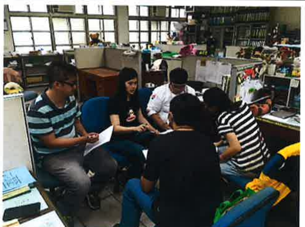
討論及發表自己想法