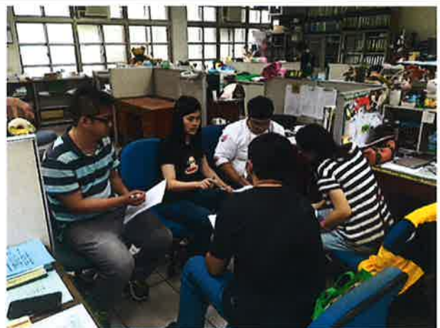
討論及發表自己想法