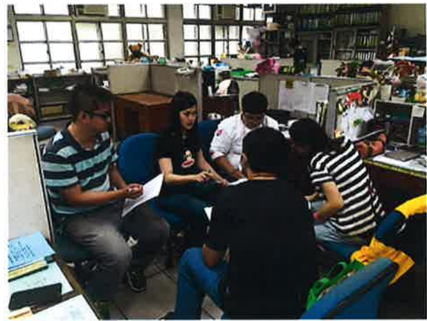
討論及發表自己想法