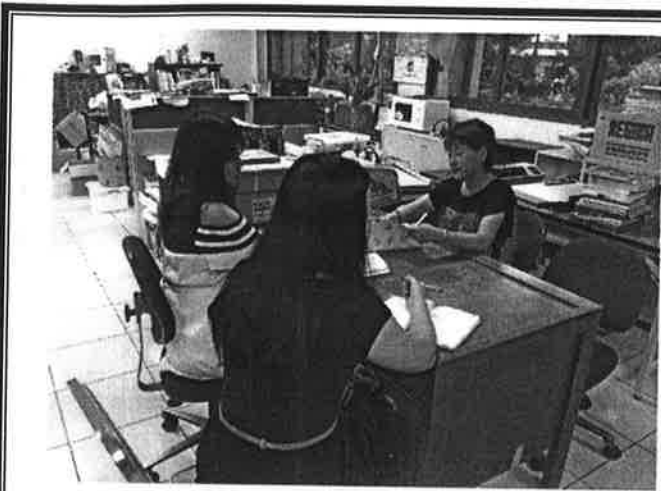
選用一年級正規班教科書