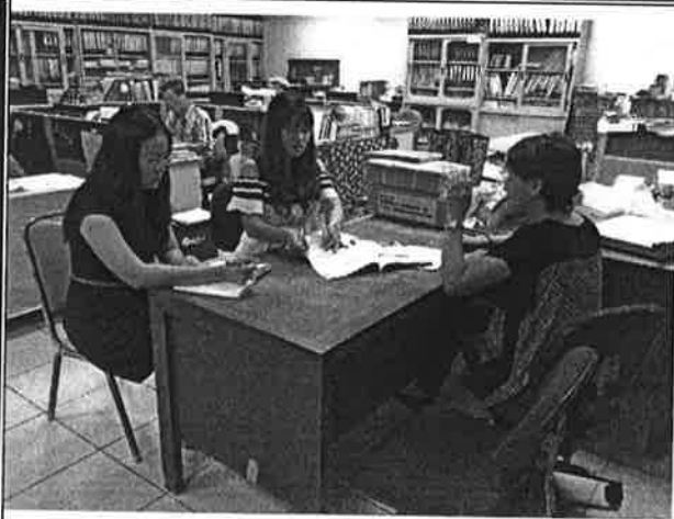
選用二年級正規班教科書