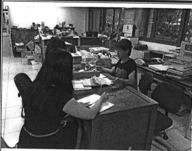
選用三年級正規班教科書