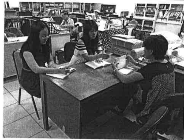
選用一年級階梯式建教班教科書