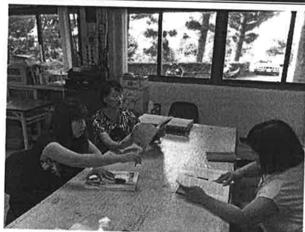
討論各版本書籍差異