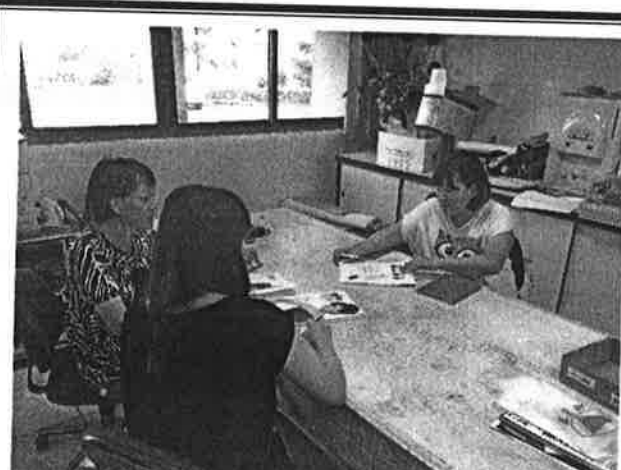
討論各版本書籍差異