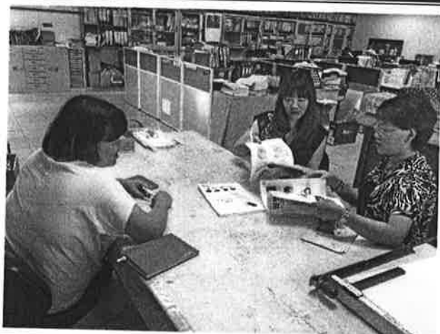
討論各版本書籍差異