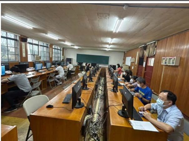
討論上傳件數過程