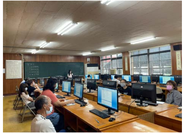
教務主任主持會議