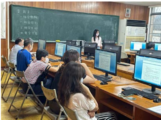
教務主任主持會議