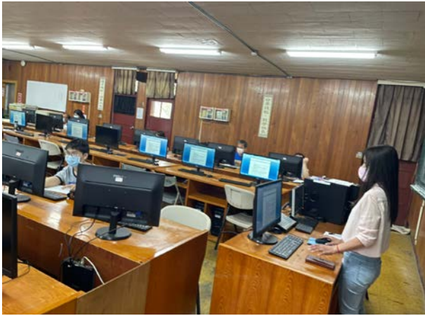
教務主任主持會議