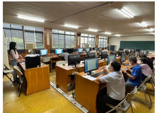
發表學習歷程規劃