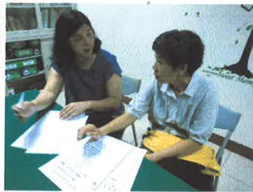
與純真老師在輔導室開期初教學研究會