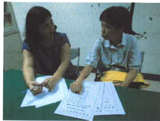
就討論提案進行說明