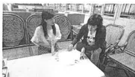
討論晨間朗讀句子