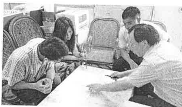
補救教學實施方式討論