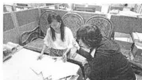
討論晨間朗讀句子