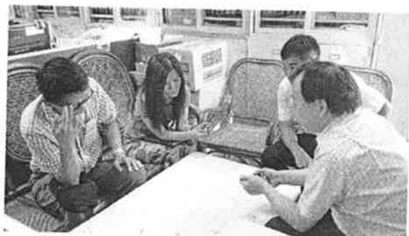
公開觀課活動討論