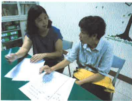
就討論提案進行說明