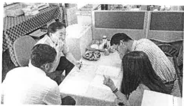
補救教學實施方式討論