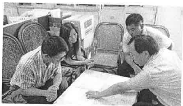
教學觀摩活動討論