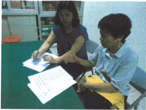
與純真老師在輔導室開期初教學研究會