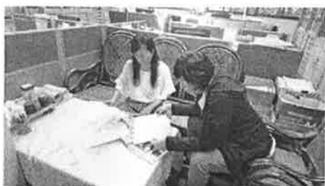
公開觀課事宜討論