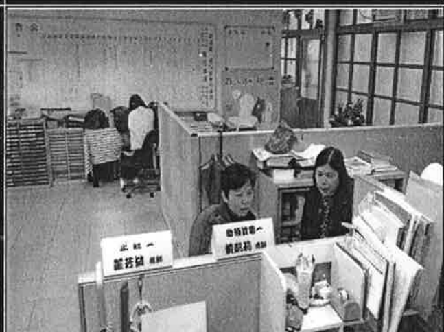
老師就討論提案提出意見