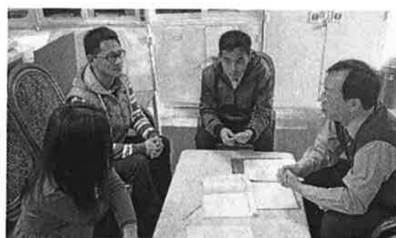
擬定本校新課綱一般目科教學重點