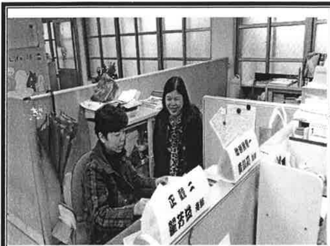
老師就討論提案提出意見