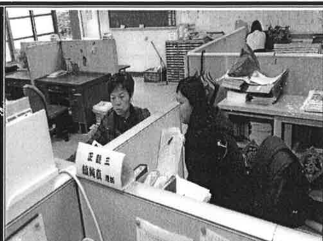
老師就討論提案提出意見