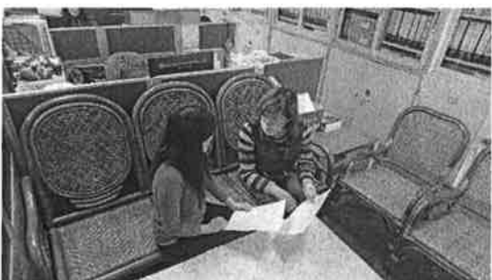
討論新課綱與學生圖像的連結性