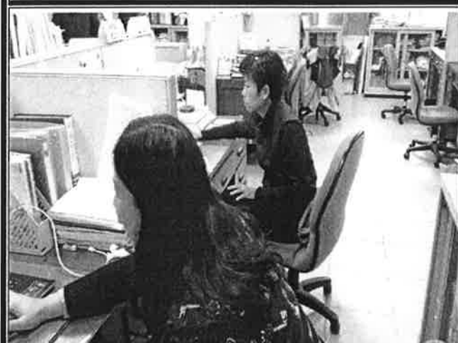
老師就討論提案提出意見