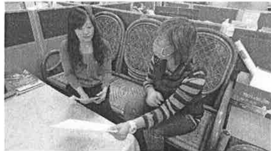
討論掌控課堂秩序要點