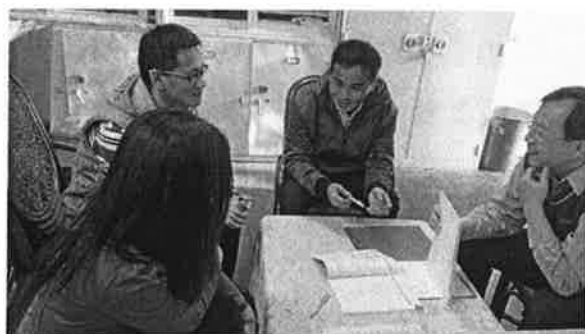
擬定本校新課綱一般目科教學重點