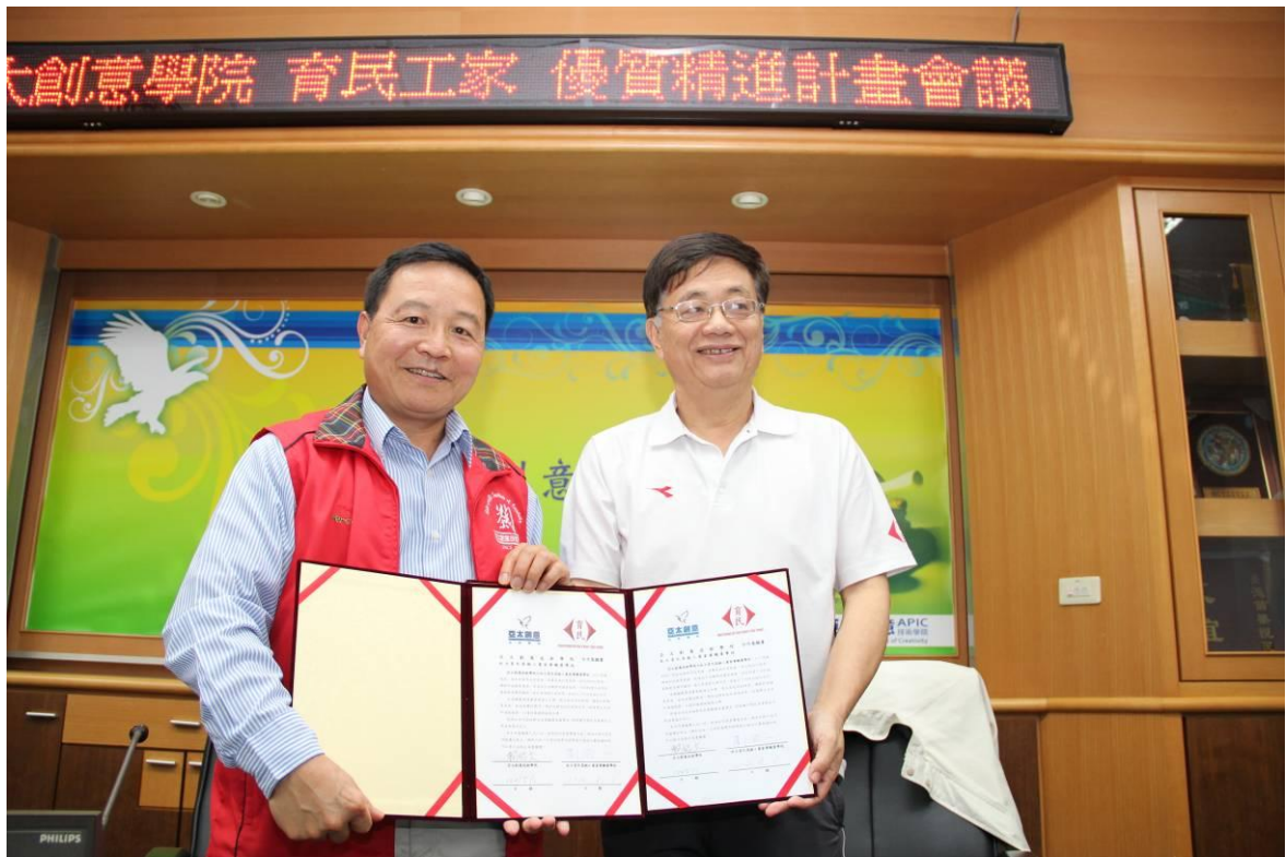
102 學年度育民工家與亞太創意學院簽訂高中職優質精進計畫合作意願書實況