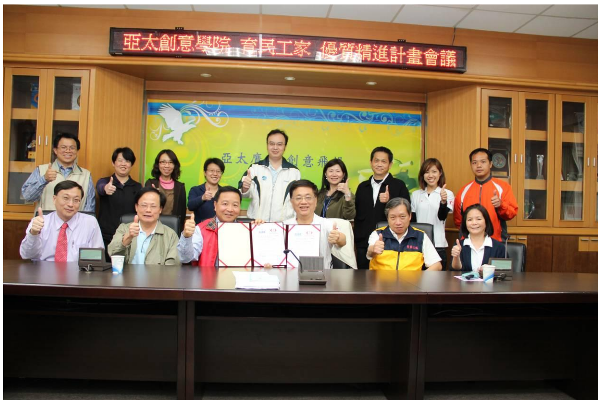
102 學年度育民工家與亞太創意學院簽訂高中職優質精進計畫合作意願合影